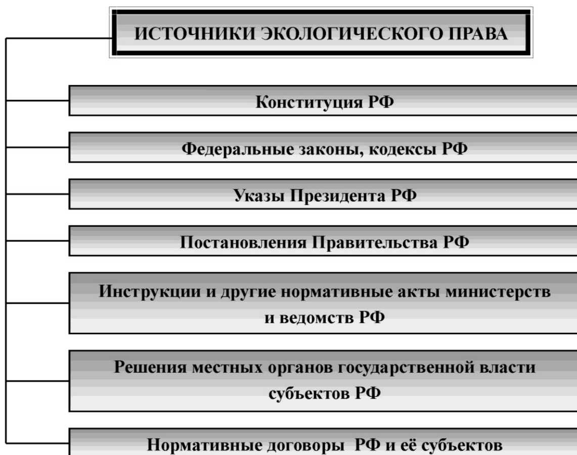
Рис. 2. Источники экологического права

2. Разобрать и зарисовать в тетрадь схему, приведённую на рис. 2, «Источники экологического права». Привести примеры каждой позиции источника экологического права. Вычленить основополагающие законные, подзаконные ведомственные акты в области природопользования, охраны окружающей среды и обеспечения экологической безопасности. Сделать вывод.