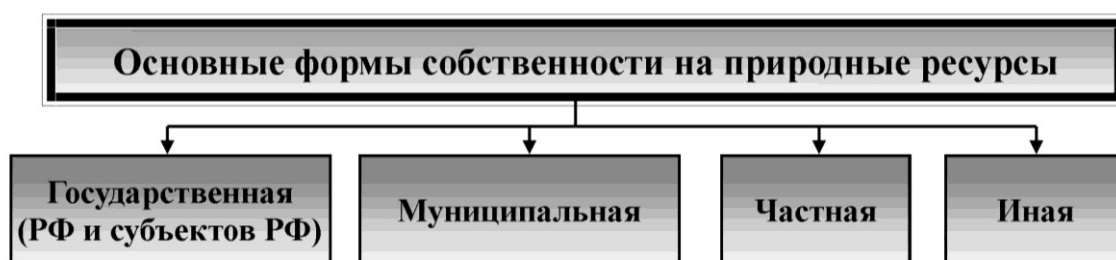
Рис.3. Формы собственности на природные ресурсы